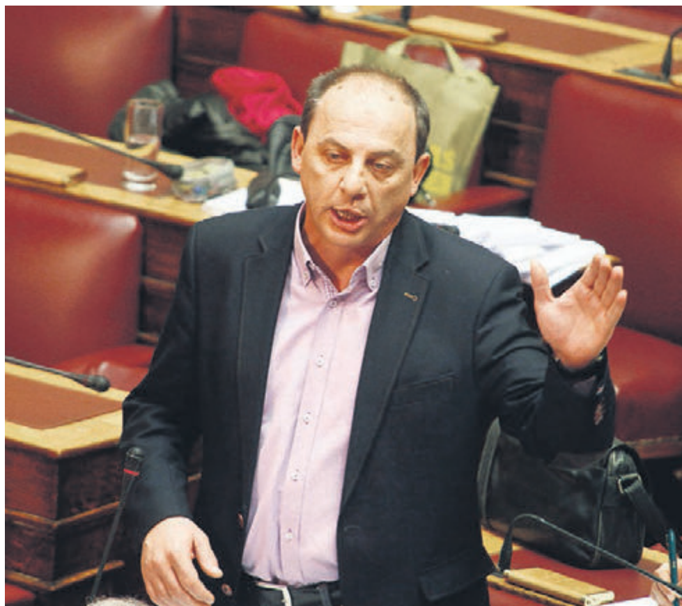
Χρήστος Καραγιαννίδης, βουλευτής Δράμας του ΣΥΡΙΖΑ

Η ολοκλήρωση της πρώτης αξιολόγησης κατ' αρχάς σηματοδοτεί την υλοποίηση από ελλη-