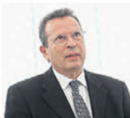
ΤΟΥ ΕΥΡΩΒΟΥΛΕΥΤΗ ΤΗΣ ΝΔ ΓΙΩΡΓΟΥ ΚΥΡΤΣΟΥ