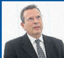
ΤΟΥ ΕΥΡΩΒΟΥΛΕΥΤΗ ΤΗΣ ΝΑ ΓΙΩΡΓΟΥ ΚΥΡΤΣΟΥ

Η αποκάλυψη από την Επιτροπή Ανταγωνισμού της ύπαρξης καρτέλ κατασκευαστικών εταιρειών το οποίο ανέβαζε με τις κατάλληλες μεθοδεύσεις το κόστος των δημοσίων έργων και των ΣΔΙΤ (συνπράξεις δημόσιου και ιδιωτικού τομέα) μπορεί να οδηγήσει σε αποφάσεις για καθυστέρηση της ευρωπαϊκής χρηματοδότησης συγκεκριμένων έργων και γενικότερα του ΕΣΠΑ.