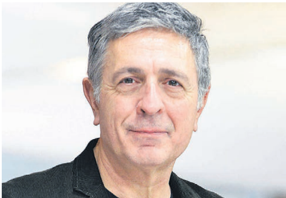
Στέλιος Κούλογλου, ευρωβουλευτής του ΣΥΡΙΖΑ

Φοβάμαι ότι πρόκειται για γεγονός ανάλογης ιστορικής σημασίας με την πτώση του τείχους του Βερολίνου και είμαι πολύ απογοητευμένος από τις αντιδράσεις της ευρωπαϊκής ηγεσίας και τη σχετική συζήτηση αυτή την εβδομάδα στο Ευρωκοινοβούλιο. Ελάχιστοι έθεσαν τα βασικά ερωτήματα: Γιατί η πλειοψηφία των Βρετανών γύρισε την πλάτη στην