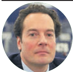
ΤΟΥ ΚΩΣΤΑ ΜΠΟΤΟΠΟΥΛΟΥ*

Στην πολιτική η αδικία είναι ο κανόνας και όχι η εξαίρεση. Μετά τη Βρετανία, την παγκόσμια οικονομία, την Ε.Ε., τις πιο αδύναμες χώρες και την πολιτική γενικώς, ένα έμμεσο θύμα του Brexit είναι πιθανό να είναι η Αριστερά. Εννοείται ότι μιλάμε για την πραγματική Αριστερά: εκείνη που πράττει δημοκρατικά χωρίς να φλυαρεί περί δημοκρατίας, που προστατεύει τα πιο ευαίσθητα κοινωνικά στρώματα μέσα από την αλήθεια και όχι το ψέμα, που είναι διεθνοιστική από επιλογή και όχι από φόβο, που καταλαβαίνει ότι το ρολόι της Ιστορίας πρέπει να πάει μπροστά και όχι πίσω, που εμπιστεύεται χωρίς να χειραγωγεί τον λαό και χωρίς να του φορτώνει τις δικές της ευθύνες.