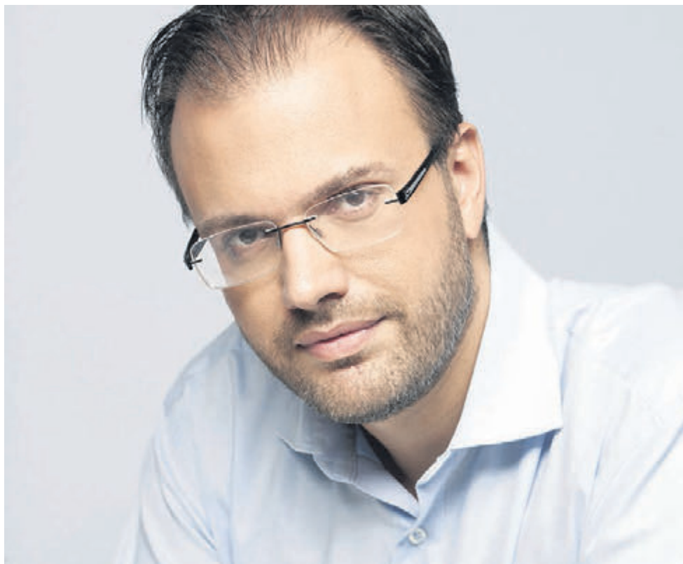
Θανάσης Θεοχαρόπουλος, πρόεδρος της ΔΗΜΑΡ, κοινοβουλευτικός εκπρόσωπος της Δημοκρατικής Συμπαράταξης

Η κυβέρνηση, αντιμετωπίζοντας αδιέξοδο στην οικονομία λόγω της πολιτικής της, θέλησε να αλλάξει τη συζήτηση από τα κρίσιμα προβλήματα, με τον εκλογικό νόμο, η αλλαγή του οποίου βέβαια είναι απαραίτητη. Ζητήσαμε από την πρώτη στιγμή της διακυβέρνησης του ΣΥΡΙΖΑ να φέρει άμεσα αλλαγές στο εκλογικό σύστημα. Για 17 μήνες ο ΣΥΡΙΖΑ δεν το έπραξε. Σήμερα, αφού συνειδητοποίησε ότι τα εκλογικά ποσοστά του καταβαρθώνονται οριστικά και